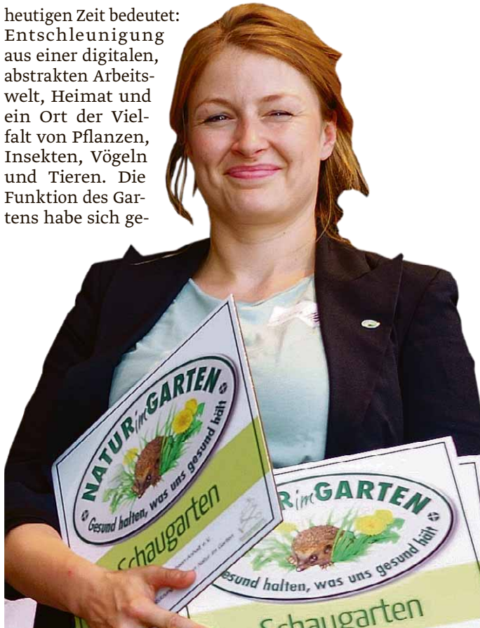
Eine Mitarbeiterin des Symposiums zeigt die Tafeln, die auf die besonderen Schau-Gärten hinweisen.

heutigen Zeit bedeutet: Entschleunigung aus einer digitalen, abstrakten Arbeitswelt, Heimat und ein Ort der Vielfalt von Pflanzen, Insekten, Vögeln und Tieren. Die Funktion des Gartens habe sich ge-