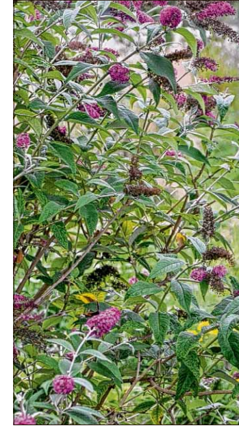
Viele Wildpflanzen können bestaunt werden.

„Über praktische Tätigkeiten können wir mit den Menschen ins Gespräch kommen“, sagt der Gartentherapeut. Es genüge mitunter, gemeinsam mit den älteren, häufig demenzten Bewohnern etwa Küchenkräuter zu bestimmen, dann