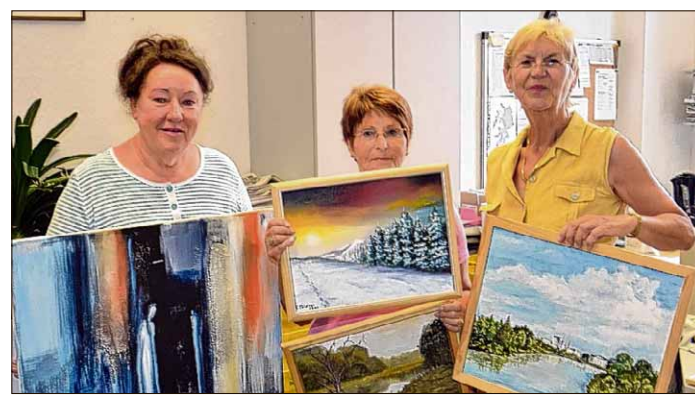
Hobbymalerinnen präsentieren ihre Bilder.