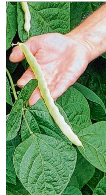
Auch alte Gemüsesorten wie diese Bohnen gibt es