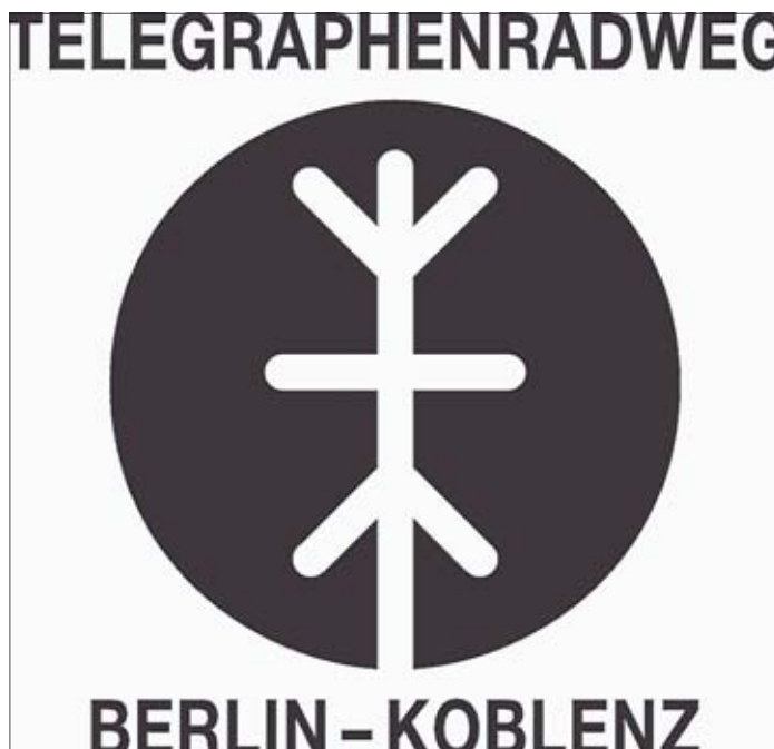
So sieht das Logo des Telegraphenradweges aus.