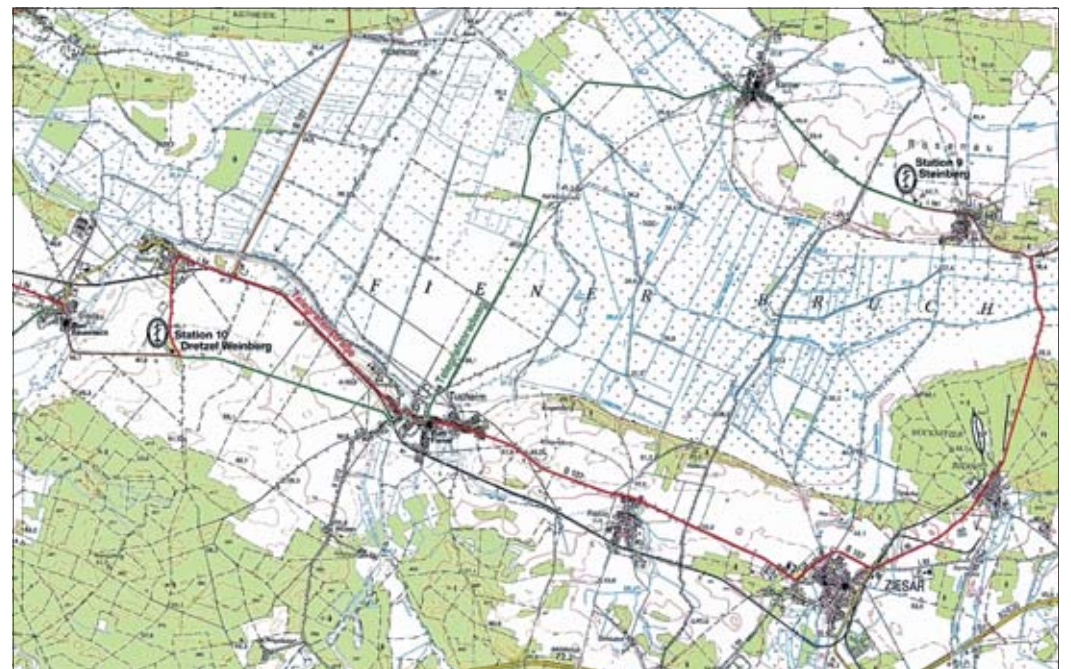
Auch der Fiener ist mit der ehemaligen Station auf dem Weinberg in Dretzel einbezogen.