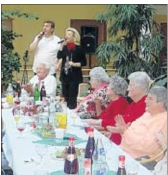
Beste Stimmung herrschte beim Weinfest.