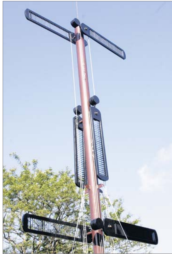
Ähnlich der Telegraphenattrappe in Ziegelsdorf (Bild) könnte auch die Telegraphenstation Nr. 10 auf dem Weinberg in Dretzel aussehen haben.

Die technische Umsetzung des Bauprojektes könnte im März des kommenden Jahres beginnen, mit der Ziel der Fertigstellung zum 1. Mai 2012.