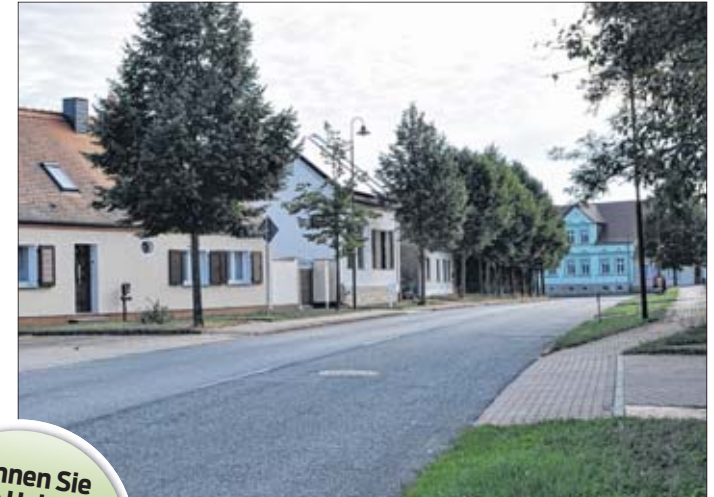
Das alte Bild ist kurz nach der Wende aufgenommen. Das aktuelle Bild ist zwei Tage alt.