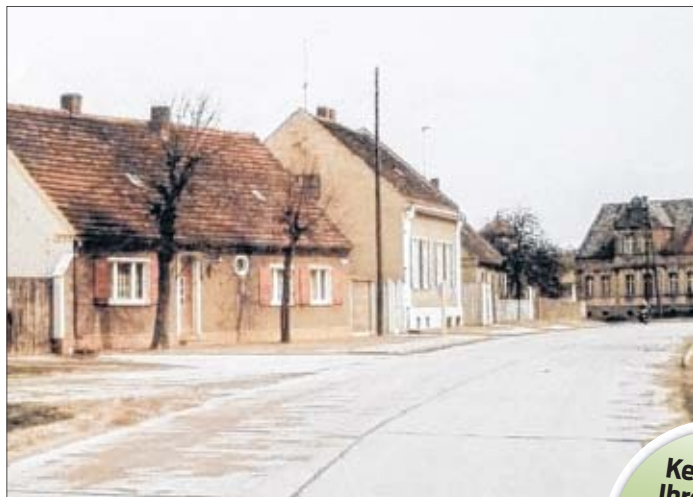
Manchmal müssen es nicht 100 Jahre sein, die es braucht, dass sich das Bild eines Dorfes um fast 180 Grad dreht ...

Ganz genau weiß es auch Friederike Stieger. Das zehnjährige Mädchen ist gebürtige Kletznickerin und wohnt genau in diesem großen, prägnanten Haus. „Ich selbst kenne es zwar nur in Grün, aber ich kenne viele alte Fotos“, erklärt sie, wie sie das Haus erkennen konnte. Ebenfalls gebürtige