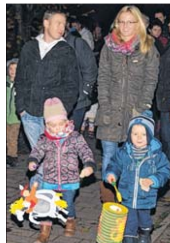
Umzug mit bunten Laternen...

wieder gemeinsam mit Pfarrer Breit gesungen. Draußen warteten schon die Kameraden der Feuerwehr, die den Laternenumzug zur Kita begleiteten. Wie schon seit Jahren hatte die Feuerwehr wieder auf vielerlei Weise geholfen: Auch das Feuer wurde betreut, und Festzeltgarnituren für das gesellige Beisammensein ausgeliehen.