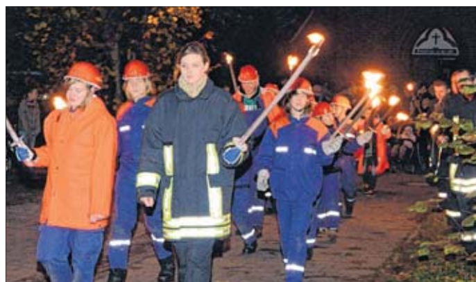
Derbens Jugendfeuerwehr führt den Umzug an.